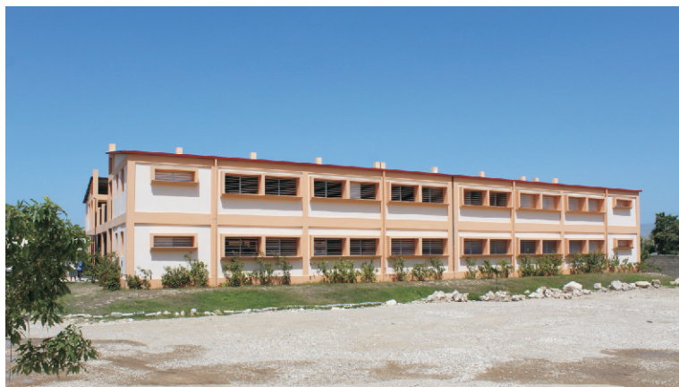
Vue du bâtiment de l'Institut Montfort.

La célébration du 60e anniversaire de l'Institut Montfort, institution spécialisée dans l'enseignement des enfants sourds, a duré une année, d'avril 2016 à avril 2017. Pour marquer la date du 28 avril 2017, une messe d'action de grâce a été célébrée. Pourtant, toute une série d'activités ont été organisées en prélude à cette date notamment des journées portes ouvertes, des sorties éducatives sur des sites touristiques à Jacmel et au Cap-Haïtien. D'autres activités se réalisent après la date du 28 avril. Il s'agit entre autres, de la foire-exposition prévue au 14 mai 2017 à St Louis de Gonzague.