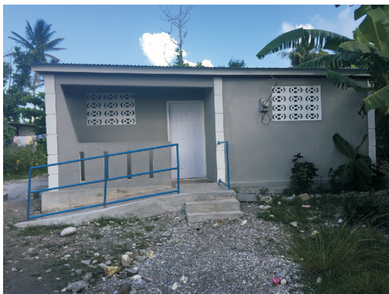
Exemple d'un logement construit en faveur d'une personne handicapée.