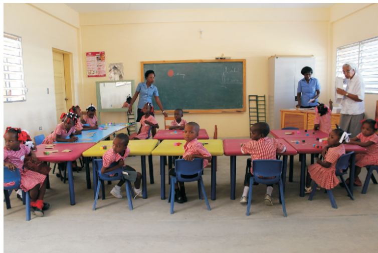
Professeurs et élèves en salle de classe, en pleine activité.