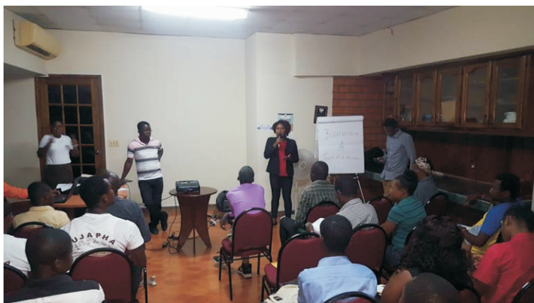
Vue de l'assistance lors de la présentation du projet.